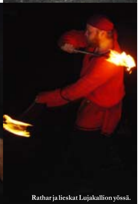
Rathar ja lieskat Lujakallion yössä.