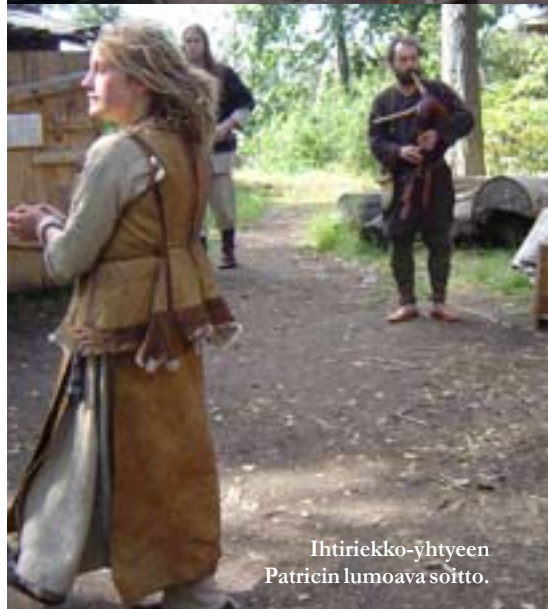
Ihtirikko-yhtyeen Patricin lumoava soitto.