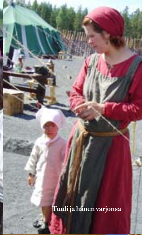
Tuuli ja hänen varjonsa

nat eivät yksinkertaisesti pysyneet kiinni maassa. Enpä ole koskaan tuntenut tuulen voimaa niin konkreettisesti kuin sinä iltpäivänä.