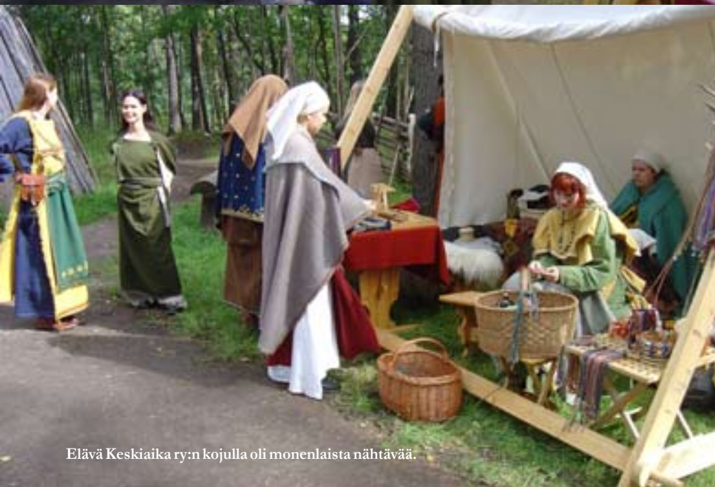
Elävä Keskiaika ry:n kojulla oli monenlaista nähtävää.