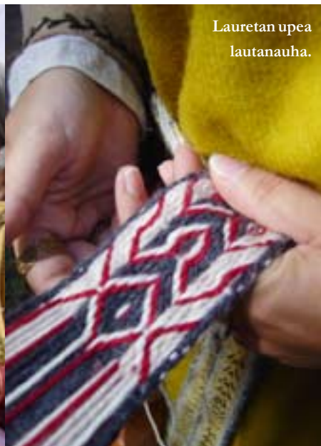
Lauretan upea lautanauha.