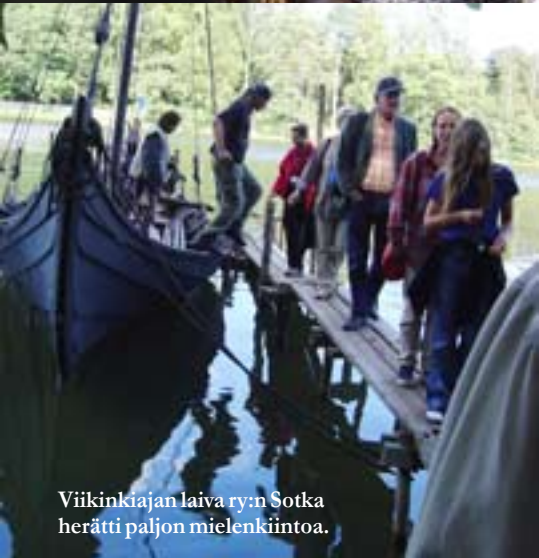
Viikinkiajan laiva ry:n Sotka herätti paljon mielenkiintoa.