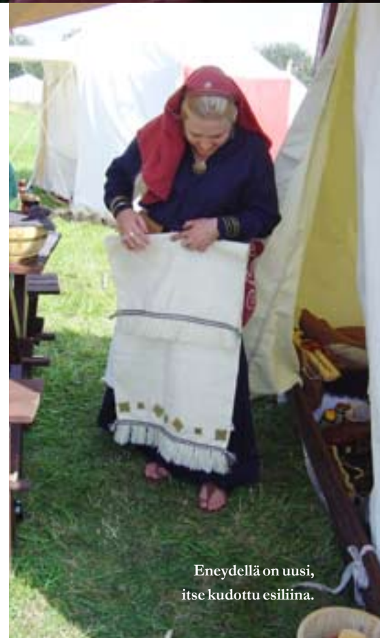
Eneydellä on uusi, itse kudottu esiliina.

Sunnuntaina illalla käytiin katsomassa aloituskonserttia, jossa ei tällä kertaa kovin suurta ihmistungosta ollut. Tunnelma oli kuitenkin katossa: meidän porukkamme aloitti letkan, joka kasvoi suureksi nurmikentällä kiemurtelevaksi madoksi kolmen eri bändin soittaessa. Mahtava kuutamo kruunasi iloisen illan.