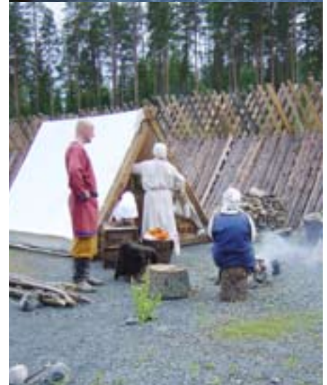
Alasin ry:n ruoanlaittohetki.