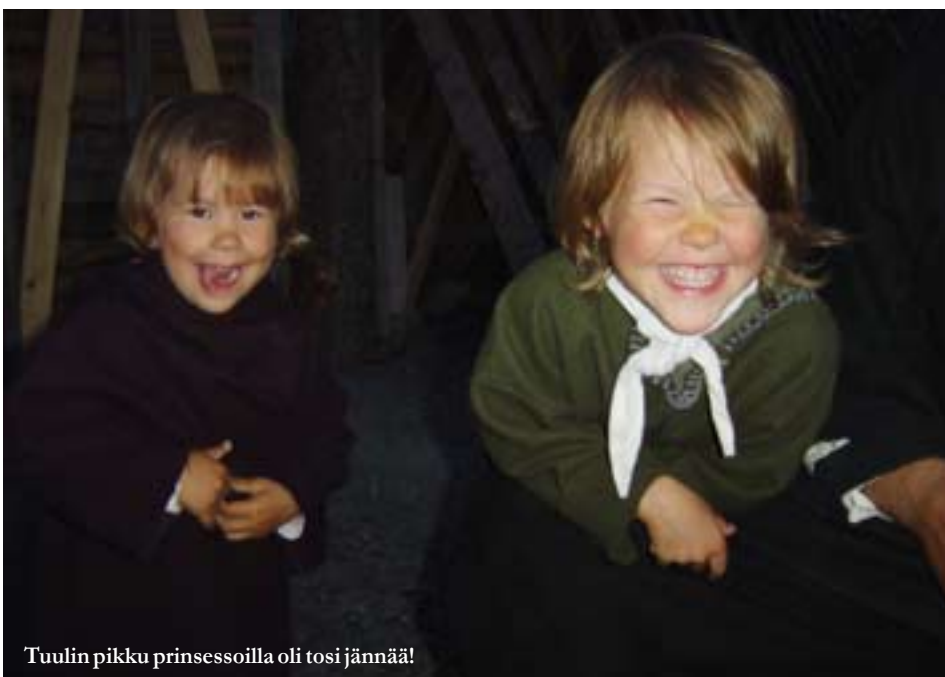
Tuulin pikku prinsessoilla oli tosi jännää!