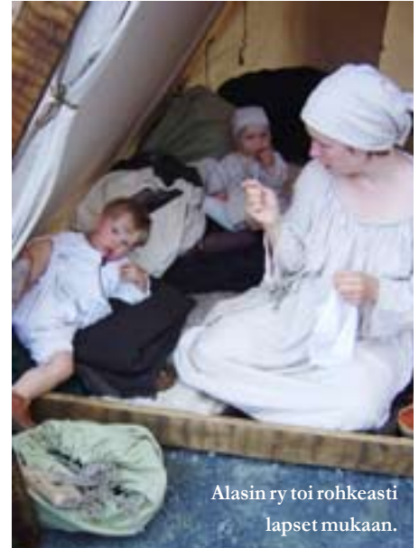
Alasin ry toi rohkeasti lapset mukaan.