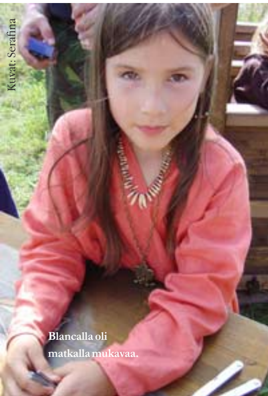
Blancalla oli matkalla mukavaa.