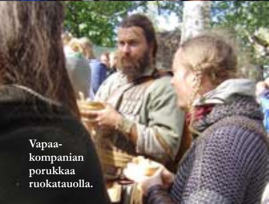
Vapaa-kompanian porukkaa ruokatauolla.