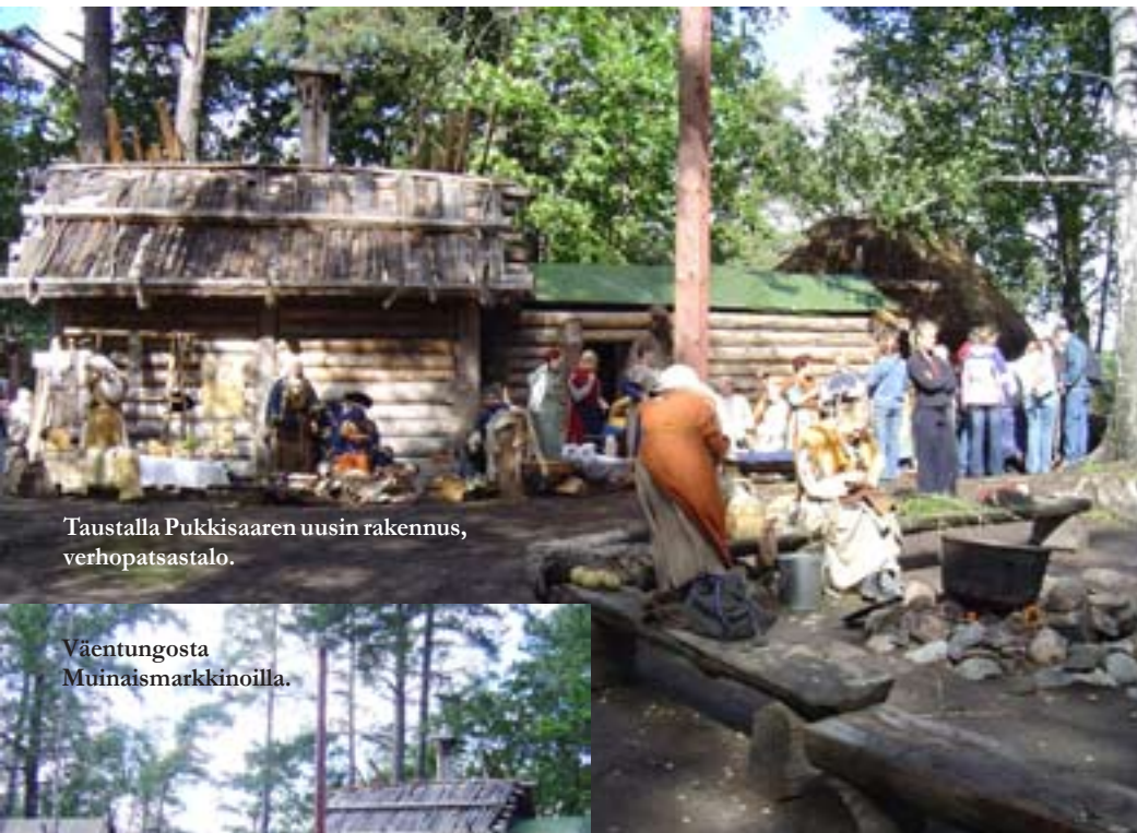
Taustalla Pukkisaaren uusin rakennus, verhopatsastalo.