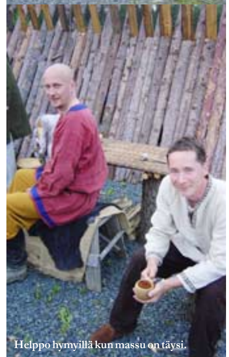
Helppo hymyillä kun massu on täysi.