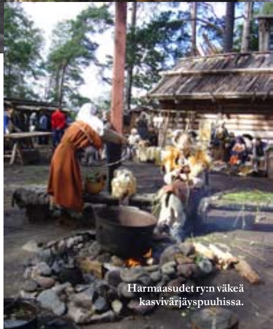
Harmaasudet ry:n väkeä kasvivärjäyspuuhissa.

Lisätiedot Sommelo ry:stä ja Pukkisaaresta: http://www.sommelo.hai.fi