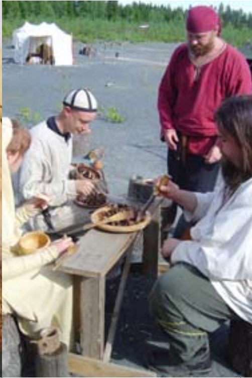
Sotansusien ruokahetki paahtavassa auringonpaisteessa.