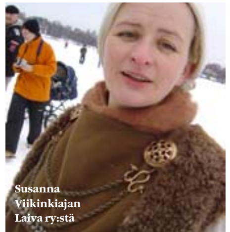
Susanna Viikinkiajan Laiva ry:stä