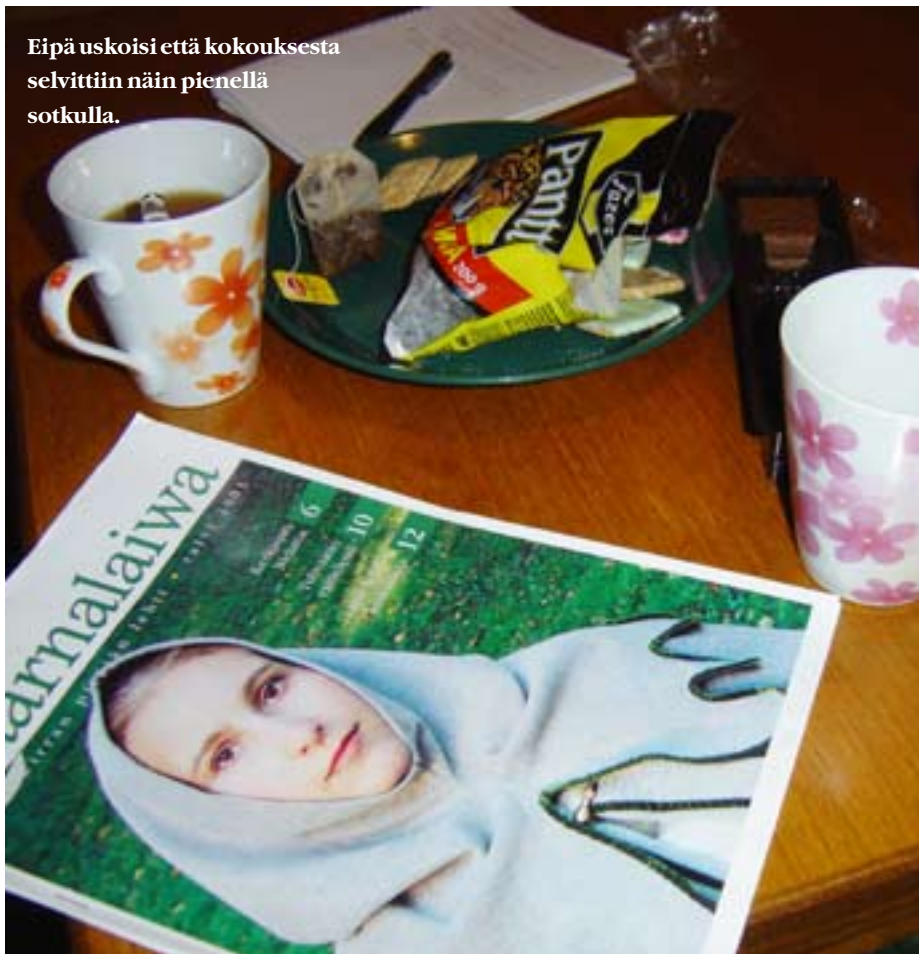
Eipä uskoisi että kokouksesta selvitettiin näin pienellä sotkulla.