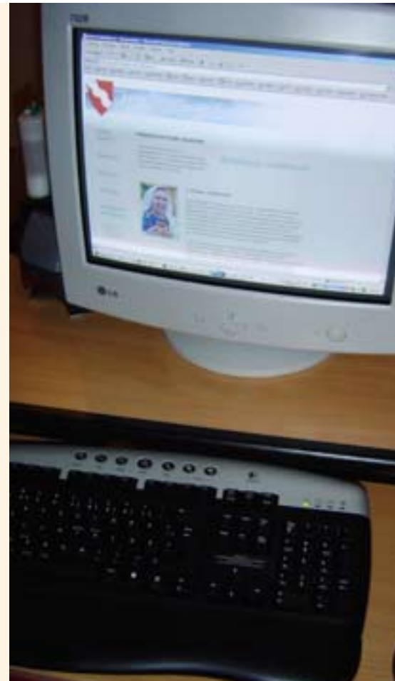
Haapawirran kylän omista sivuista pidettiin.