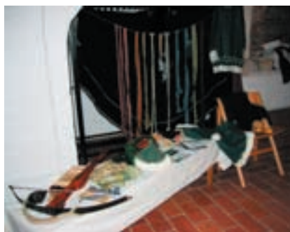
Seuran esittelypöytä Hämeenlinnan keskiaikamarkkinoilla 2003.