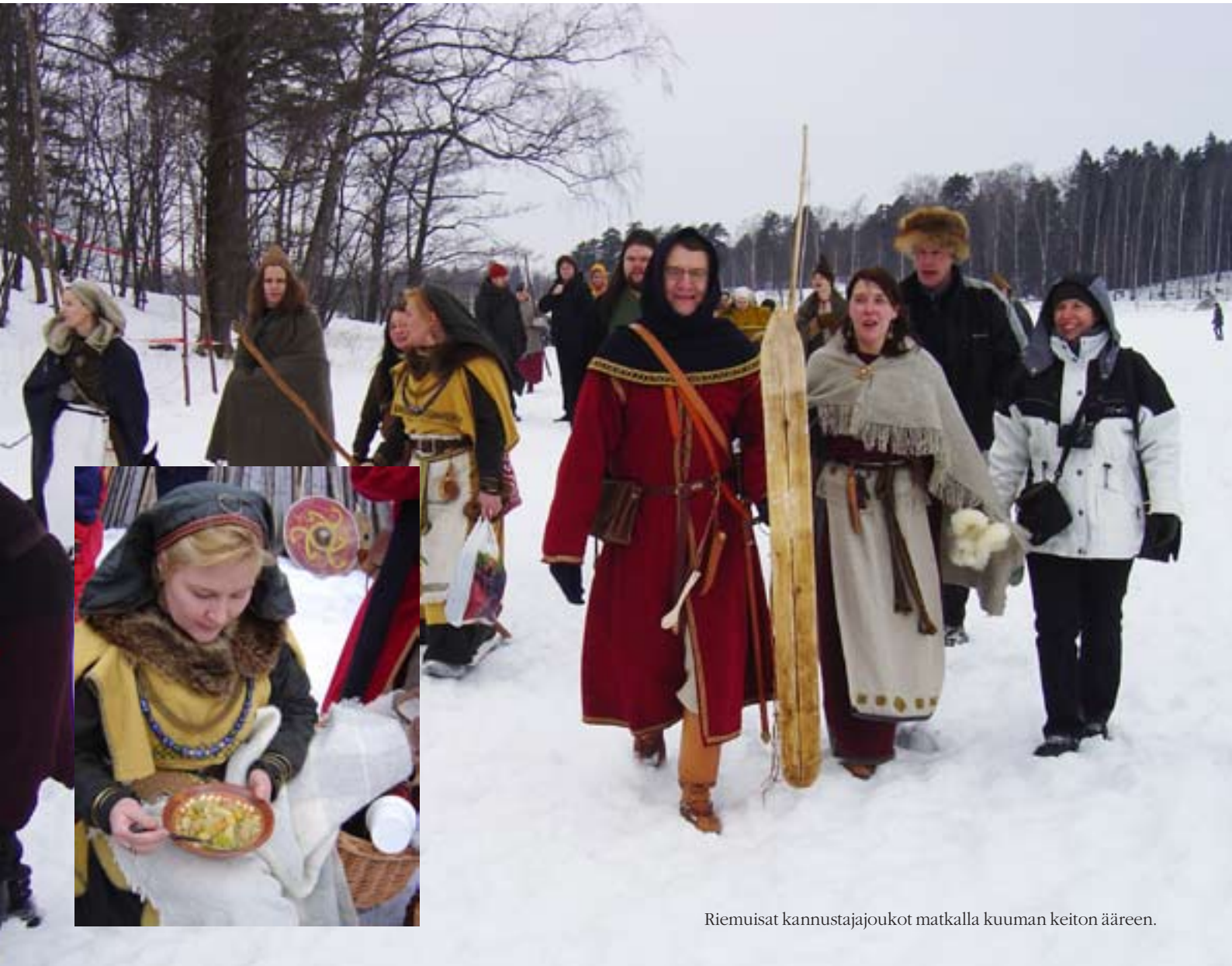
Riemuisat kannustajajoukot matkalla kuuman keiton ääreen.