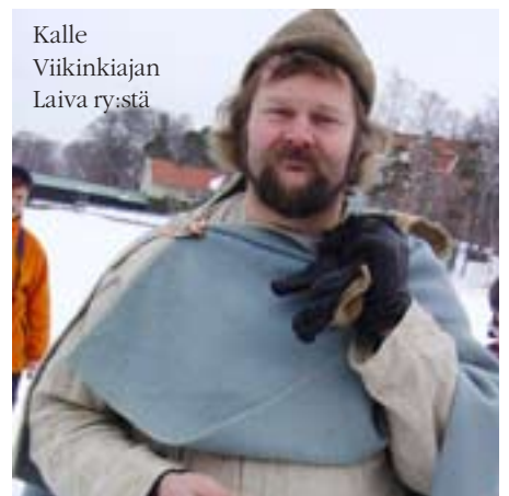
Kalle Viikinkiajan Laiva ry:stä