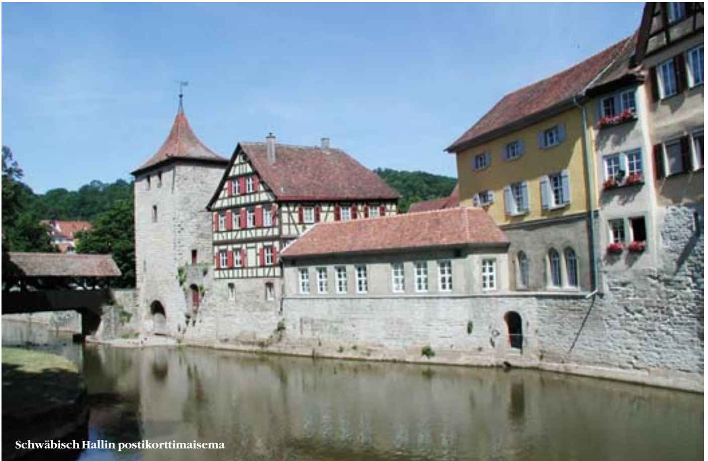
Schwäbisch Hallin postikorttimaisema

Mikäli Spitalgartenin ruokapuoli ei vie nälkää tai muuten miellyttä, kannattaa kävellä siltaa pitkin kaupunkiin ja kokeilla niin ikään 1100-luvulla rakennettua makkarakeittiötä (Wurstkuchl), joka on ollut toiminnassa lähes tauotta perustamisestaan asti. Tämä lihansyöjän unelma sijaitsee aivan sillan tyvessä rannassa ja jää usein tulva-aikana veden noustessa uppeluksiin. Omistajat jatkavat kaikesta huolimatta perinteitä sitkeästi. Nukkuttuaan ja syötyään lähtee matkailija tietenkin tutustumaan kaupungin muihin nähtävyyksiin. Niihin lukeutuvat mm. sillan kanssa samoihin aikoihin rakennettu upea goottilainen tuomiokirkko ja keskustorin laidalla oleva raatihuone, jonka vanhimmat osat ovat 1200-luvulta.