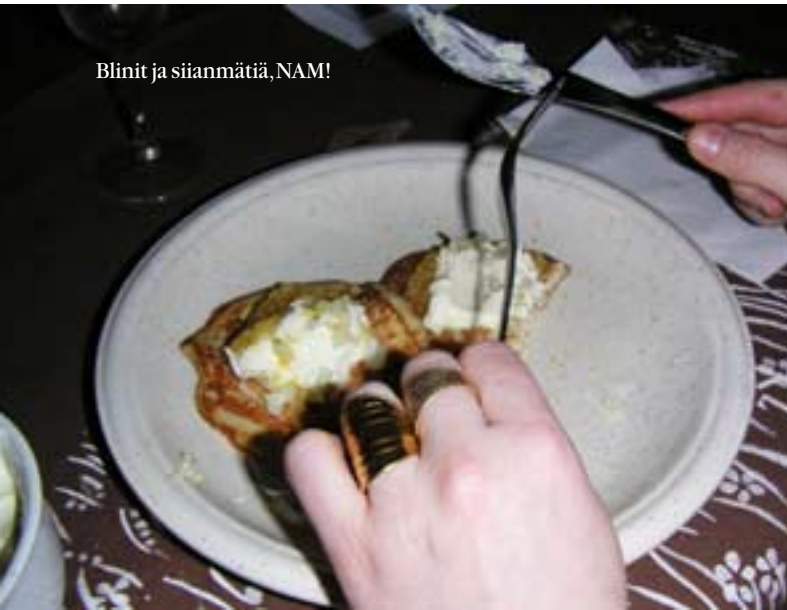
Blinit ja siianmätiä, NAM!