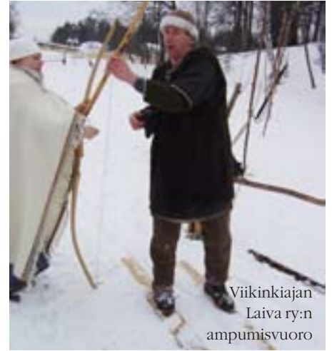
Viikinkiajan Laiva ry:n ampumisvuoro