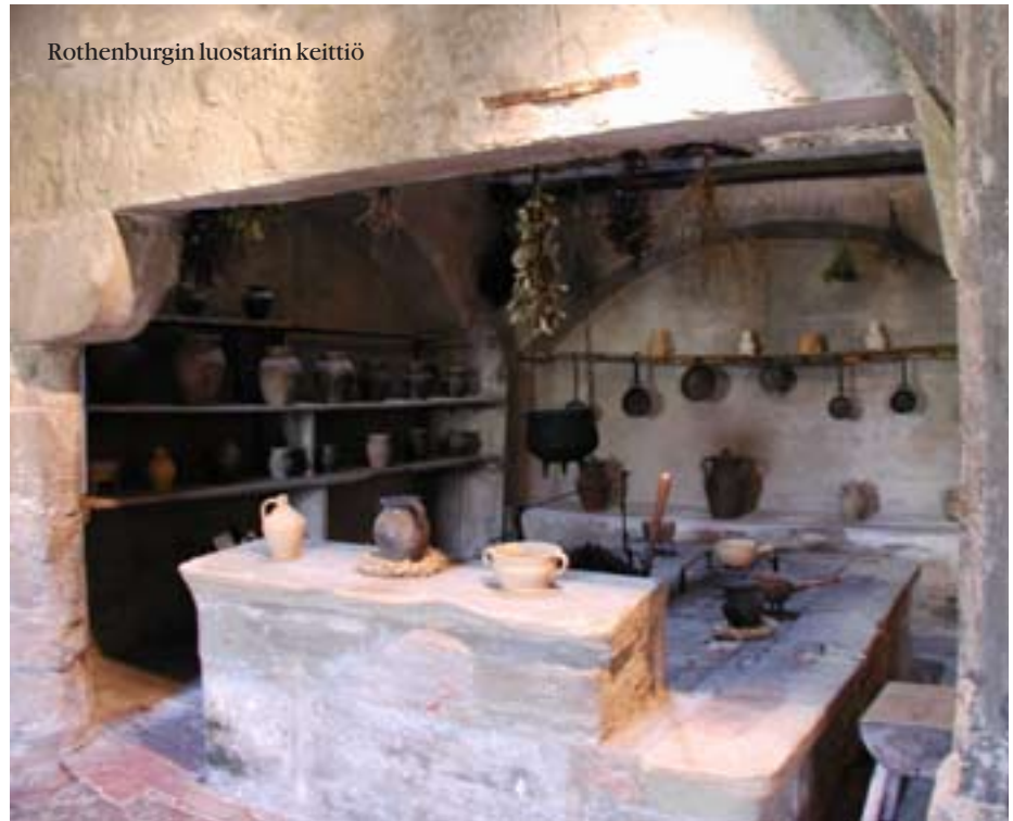
Rothenburgin luostarin keittiö

Varsin tutustumisen arvoinen on 1258 rakennetussa dominikaaninunnaaluostarissa sijaitseva taidemuseo (Reichsstadtmuseum). Siellä on vielä jäljellä luostarin