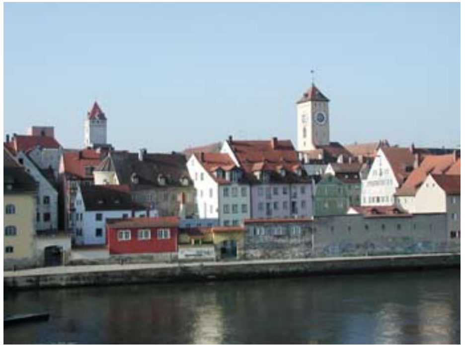
Näkymiä Tonavan yli Regensburgiin

Aloitamme matkamme Regensburgista, tuosta keskiajalla tärkeästä valtiopäivien näyttämöstä. Ensin pikainen katsaus kaupungin maineikkaaseen historiaan. Vuonna 179 ajanlaskumme jälkeen perustivat roomalaiset Tonavan rannalle Castra Regina –nimisen legioonalaisleirin. Sinne kehittyi pian pysyvää asutusta, ja vuonna 739 perustettiin Regensburgin hiippakunta Saksan aluetta käännyttäneen Pyhän Bonifatiuksen toimesta. Ollessaan Baijerin herttuana ennen keisarikruunaustaan vuonna 1002 piti Henrik II Pyhä residenssiään Regensburgissa. Sydänkeskiajalla alkoi varsinaisesti kaupungin porvarillinen historia kun se vuonna 1245 sai keisarin armosta itsehallinnon ja kohosi valtakunnankau-