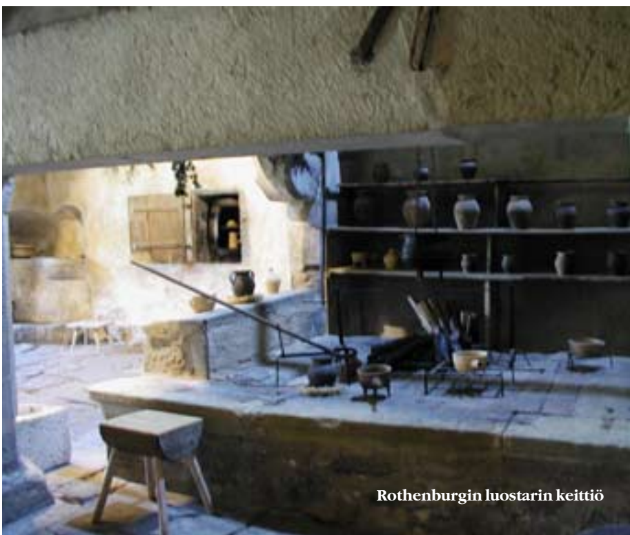
Rothenburgin luostarin keittiö

Viimeiseksi vierailemme Schwäbisch Hallissa, joka on paikallisten suuri ylpeys. Nykyisin Schwabenin alue kuuluu hallinnollisesti Baijeriin, mutta kulttuurillisesti ja murteellisesti asukkaat eroavat edelleen toisistaan – ja jaksavat korostaa tätä eroa monin pikku huomautuksin. Lähitöllä sijaitsee myös upea Comburgin benediktiiniluostari, joka perustettiin 1079. Schwäbisch Hallin alueelle syntyi asutusta jo 500-luvulla ennen ajanlaskun alkua suolan valmistuksen takia. Suolakaivotoiminnan ansiosta Schwäbisch Hallista tuli keskiajalla menestyvä kaupunki, jonne ylpeät porvarit rakensivat näyttäviä kaupunkiasuntoja ja lahjoittivat runsaasti varoja myös kirkkojen koristeluun. Täytyy sanoa, että silmä lepää kapeita katuja ja mutkittelevia kujia pitkin taivaltaessa. Paljon on Bavariassa nähtävää, mutta jätän loput kertomatta, jotta tulevilla matkoillanne saatte itse ihastella ja löytää saksalaisen keskiajan.