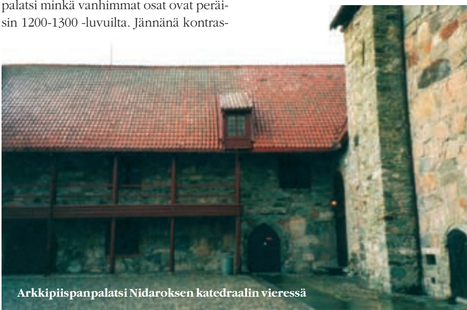
Arkkipiispanpalatsi Nidaroksen katedraalin vieressä