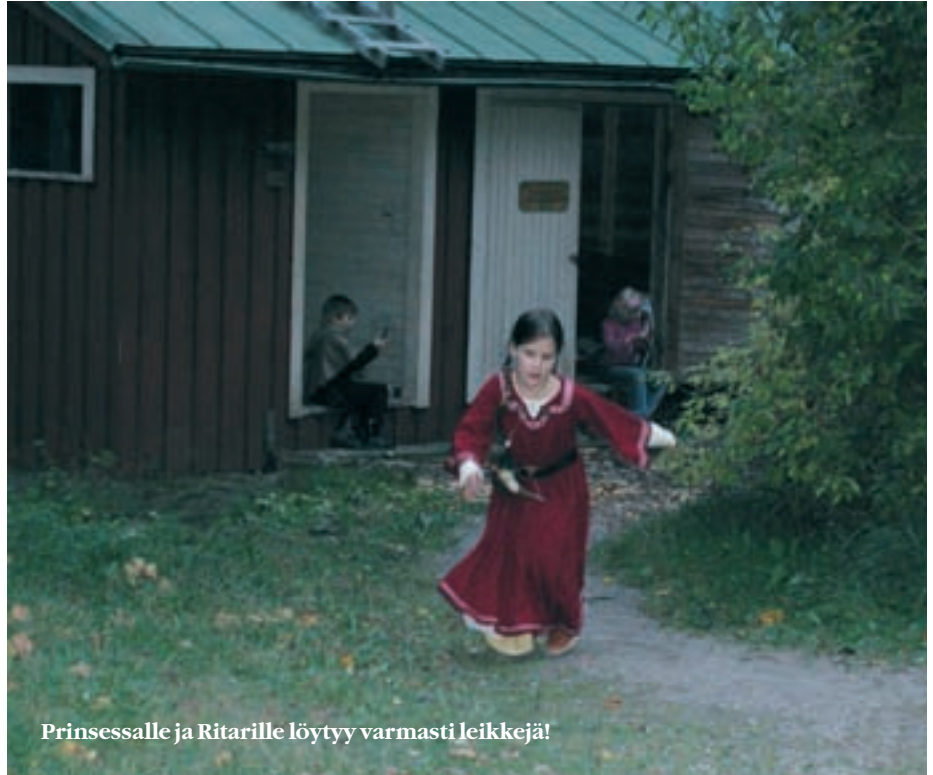
Prinsessalle ja Ritarille löytyy varmasti leikkejä!

Lapsen vanhemman on hyvä etukäteen miettiä jotain välineitä joilla lapsi voi leikkiä tapahtumassa. Tällaisia voisivat olla vaikkapa oma pieni jousi tai pienessä kirjontakehikossa kangas sekä lanka ja neula.