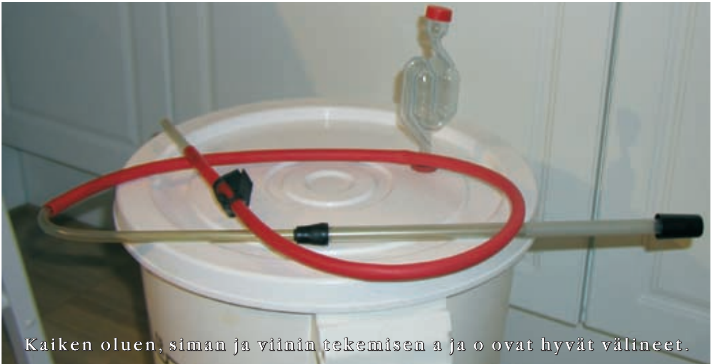
Kaiken oluen, siman ja viinin tekemisen a ja o ovat hyvät välineet.