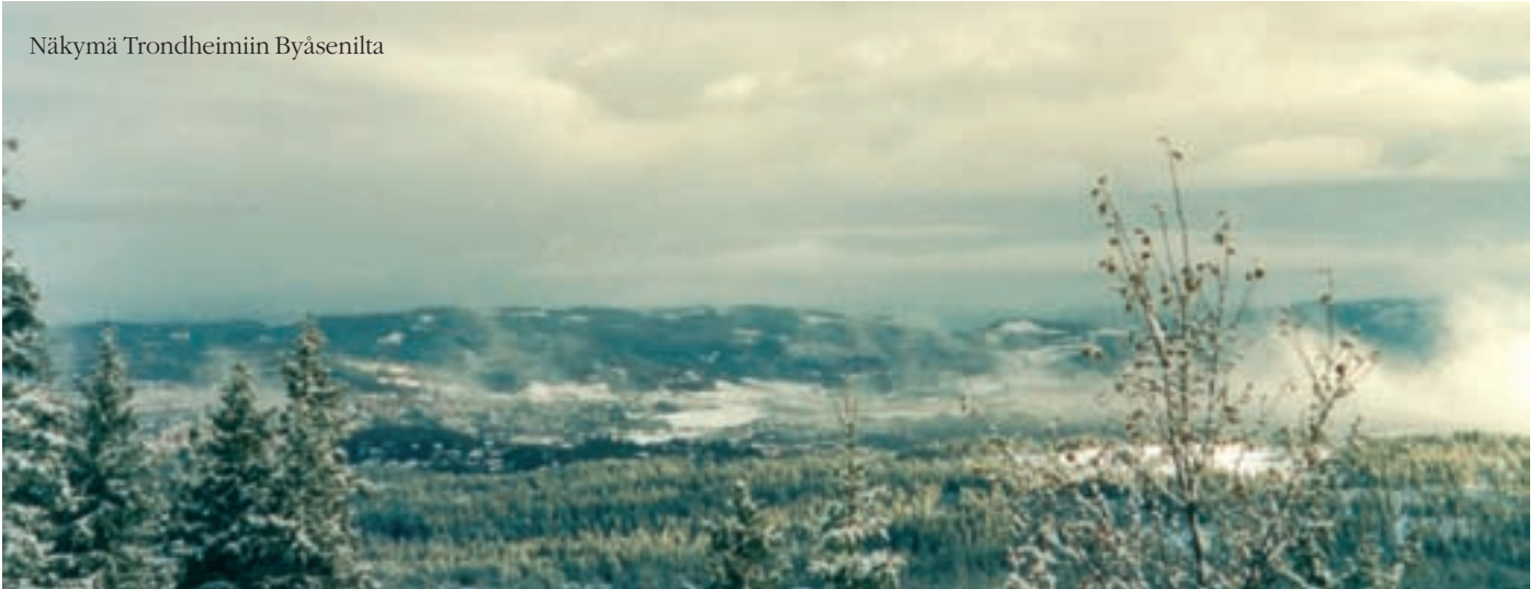
Näkymä Trondheimiin Byäsenilta

lä. Trondheim kuuluu keskiaikaiseen pyhiinvaellusreittiin ja yhä kirkon myymälästä voi ostaa todistuksen pyhiinvaellusreitille osallistumisesta. Samoin katedraalin kaupassa myydään muuta keskiaikaista kuten nunnien käsinvalmistamia saippuota sekä yrttiteetä. Katedraalin vaikuttavin osa on sen edusta, mitä hallitsevat patsaat sekä Chartres'n katedraalin inspiroima Gabriel Kiellandin ruusuikkuna. Kirkon korkeimman tornin huippu on 97,8 metriä korkea ja koko katedraalia on vaikea saada mahdumaan valokuvaan muuten kuin pitkän matkan päästä.